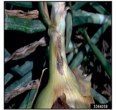
चित्र नं. ४: प्याजको गानोमा देखिएको लक्षण