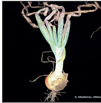
चित्र नं. ३: पातहरू घुमाउरो भई डढेको लक्षणहरू