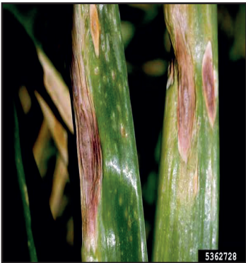
चित्र नं. १: प्याजको पातमा देखिएको लक्षण